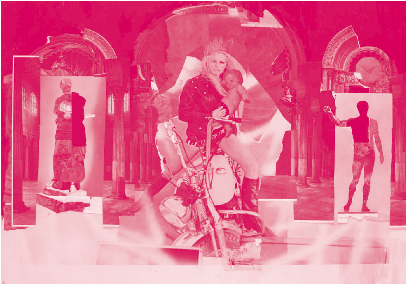
Letzte Nacht, 2009