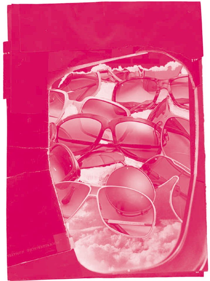
Das Fenster , 2009