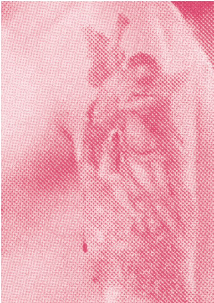
o.T. ( Amor und Psyche ), 2010