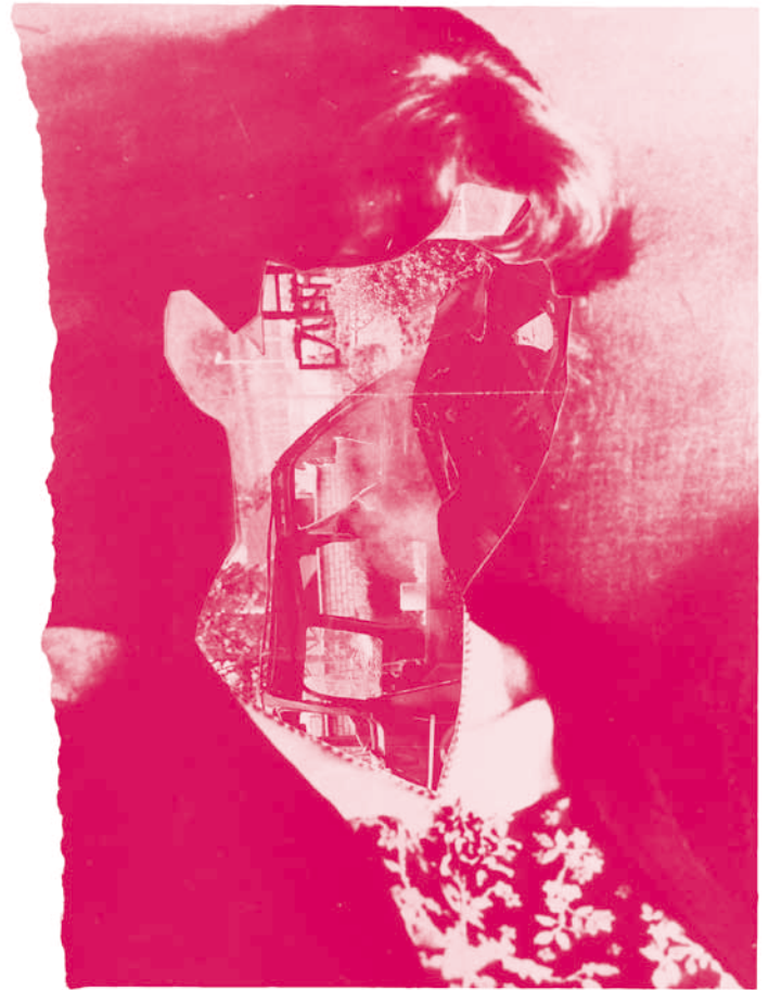
Unbekannte Frau, 2009